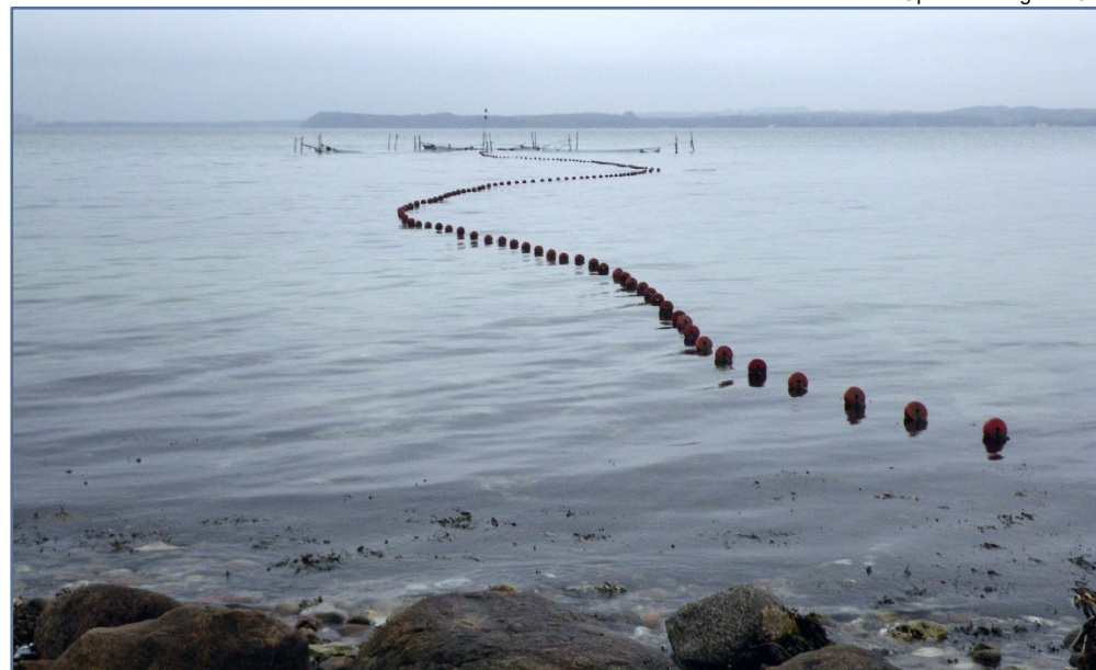
Folderen er produceret af Fiskeristyrelsen.

Vær opmærksom på, at den til enhver tid gældende fiskerilovgivning, også omfatter fiskeri ved faststående redskaber.